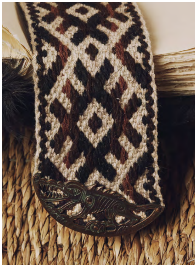
ДЕТАЛЬ: Ляссе — пояс с древнеславянскими символами — сплетено вручную по историческим образцам мастерами этнологического клуба.

Каждый экземпляр пронумерован и подписан художником и издателем. Экземпляр № 1 хранится в собрании Государственного Эрмитажа.